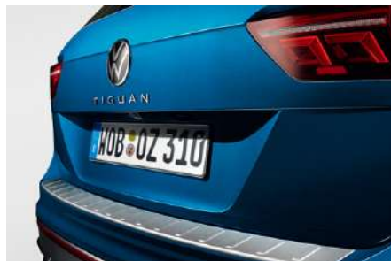
金屬質感後保防護飾板