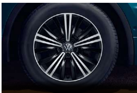
18 吋 Nizza 鋁合金輪圈