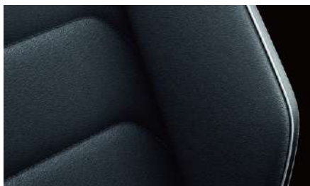
Vienna 運動型真皮座椅 ( 鎊鈦黑 )