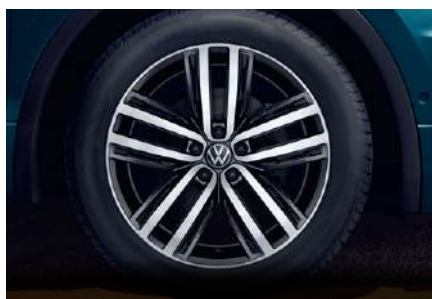
19 吋 Auckland 鋁合金輪圈