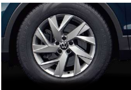
18 吋 Frankfurt 鋁合金輪圈