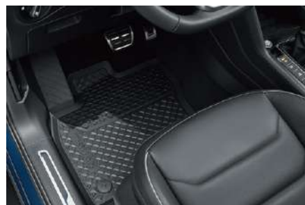
全天候橡膠腳踏墊