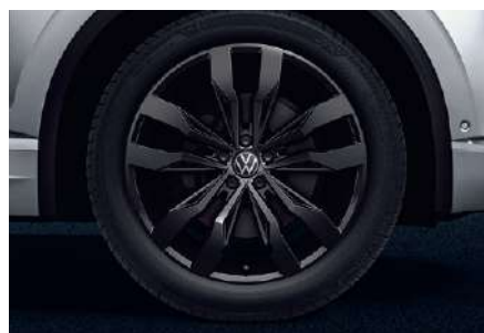
20 吋 Suzuka 鋁合金輪圈